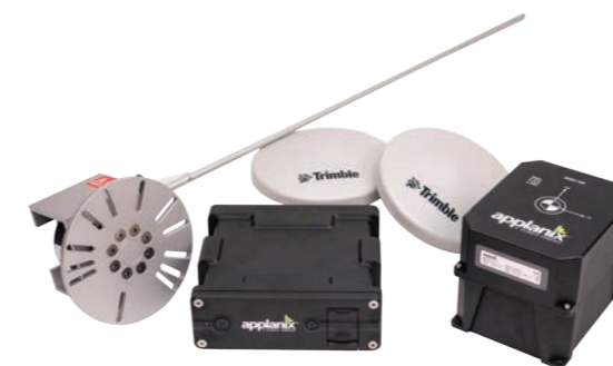
車両の位置・方位が重要となるすべての場面で。

COUNTIES POWER は、2度の受賞歴のある「PAL-GPR システム」に POS LV を採用。同システムは、地下の公益施設の位置を特定し、マップ化するための世界初のソリューションです。